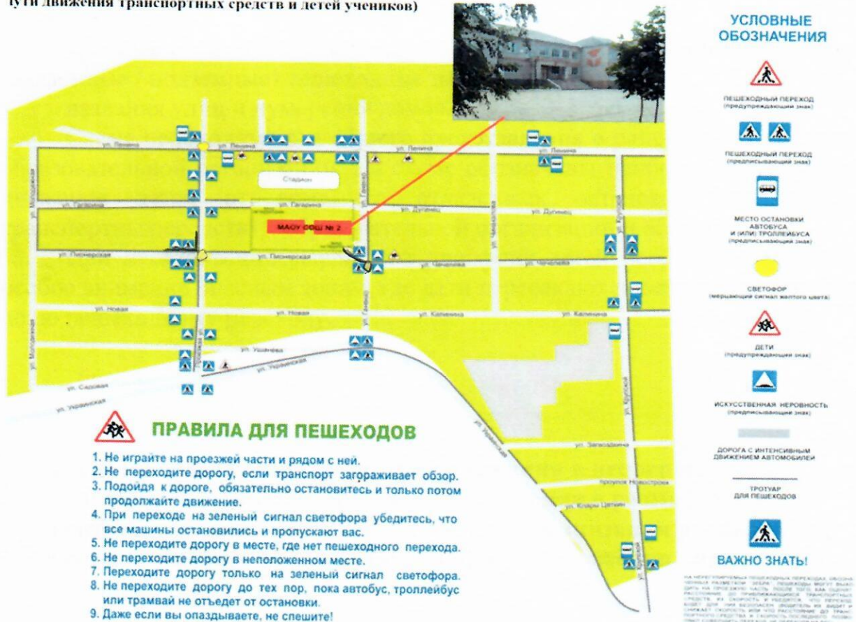
План-схема района расположения ОУ, (пути движения транспортных средств и детей учеников)